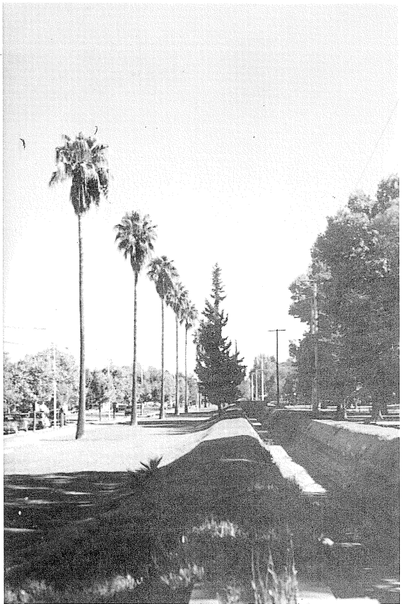
Boulevard de las Palmeras.