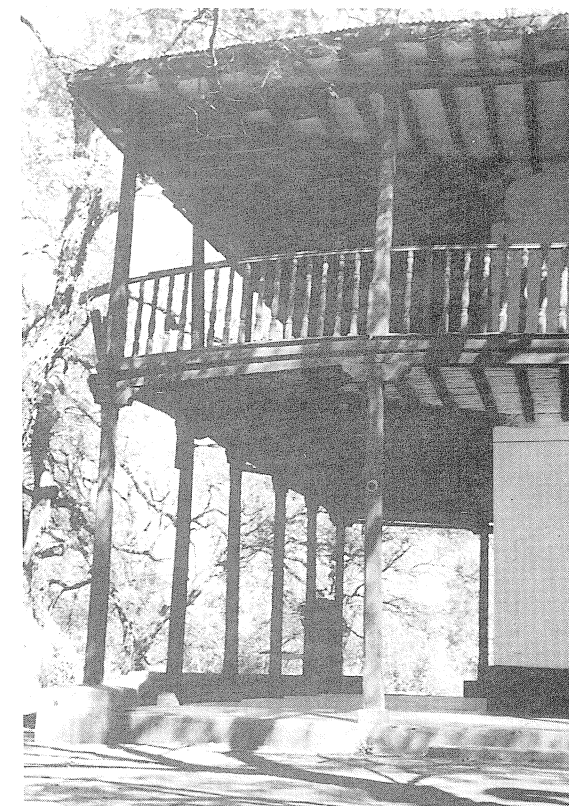
Casa de Tiburcio Benegas.